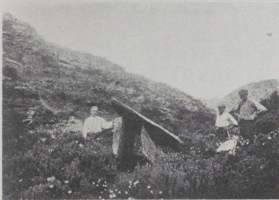
Fig. 83. — Llansà. Sepulcre de la Riera Pujolar

S'excavaren uns 0'50 metres de terra i pedres, sense trobar-s'hi res.